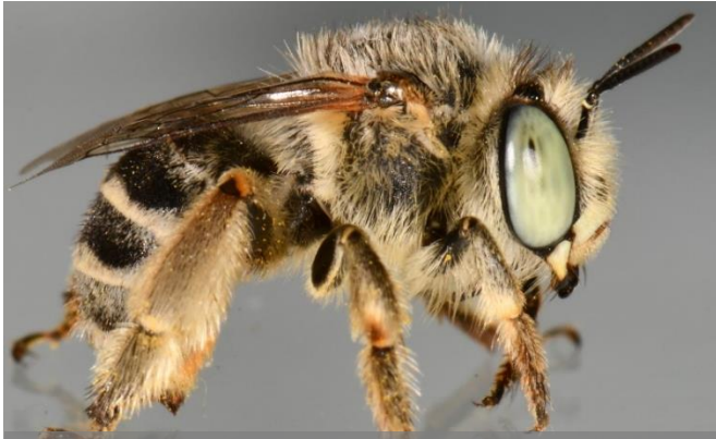
Pelzbienen ( Anthophora )