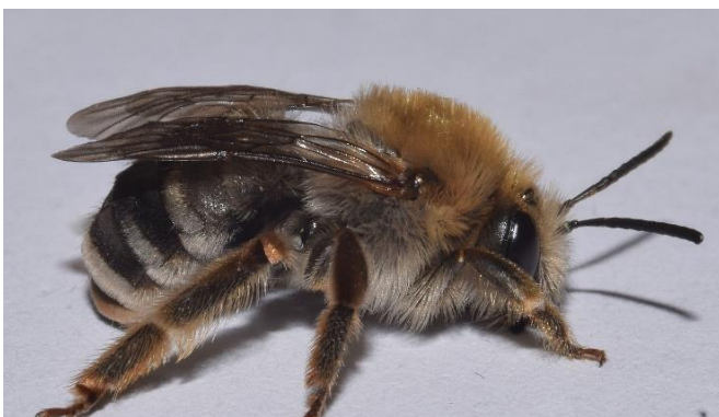
Langhornbienen Weibchen ( Eucera )