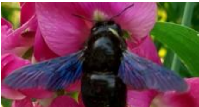
Holzbienen ( Xylocopa )