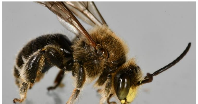
Schenkelbienen ( Macropis )