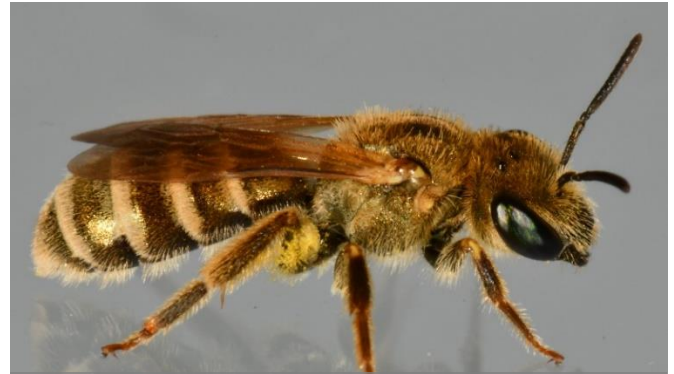
Furchenbienen ( Halictus )