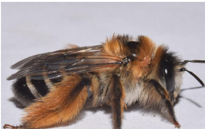
Hosenbienen Weibchen ( Dasypoda )