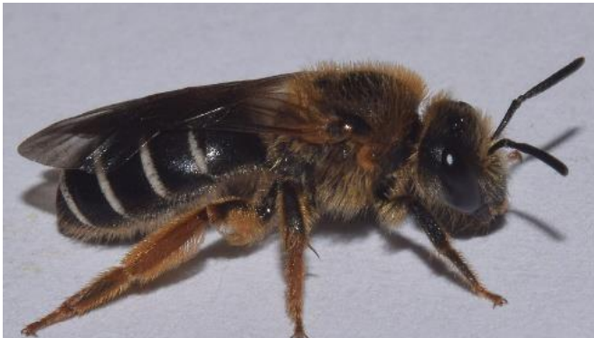
Furchenbienen ( Halictus )