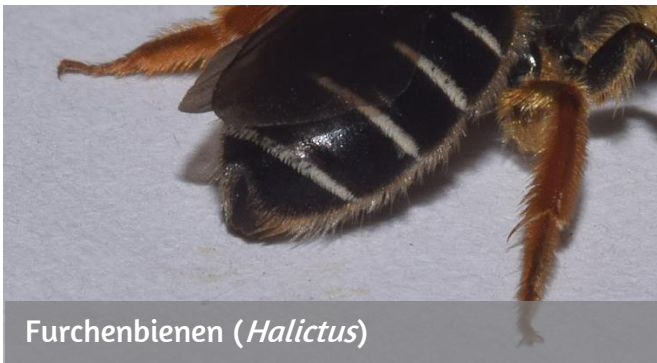
Furchenbienen ( Halictus )