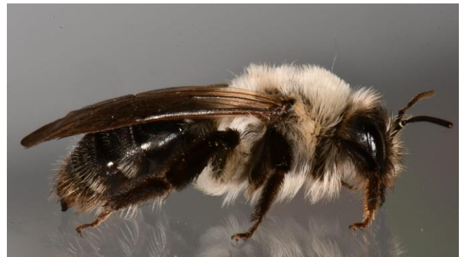
Sandbienen ( Andrena )