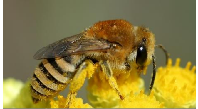
Seidenbienen ( Colletes )