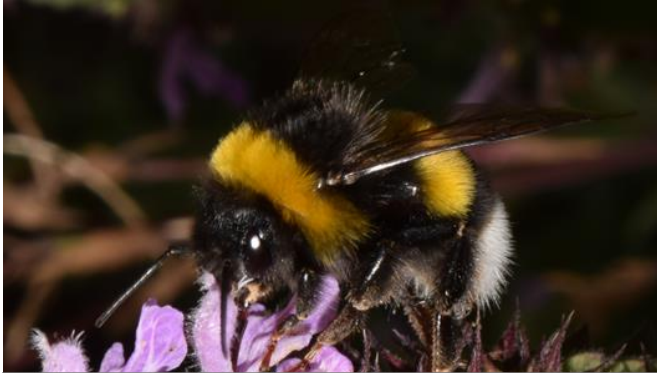
Hummeln ( Bombus , teilw.)