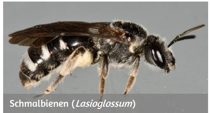
Schmalbienen ( Lasioglossum )