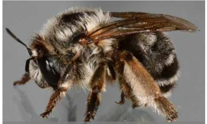
Pelzbienen ( Anthophora )