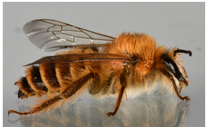
Hosenbienen Männchen ( Dasypoda )