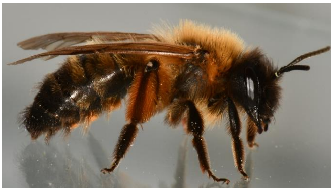
Sandbienen ( Andrena )